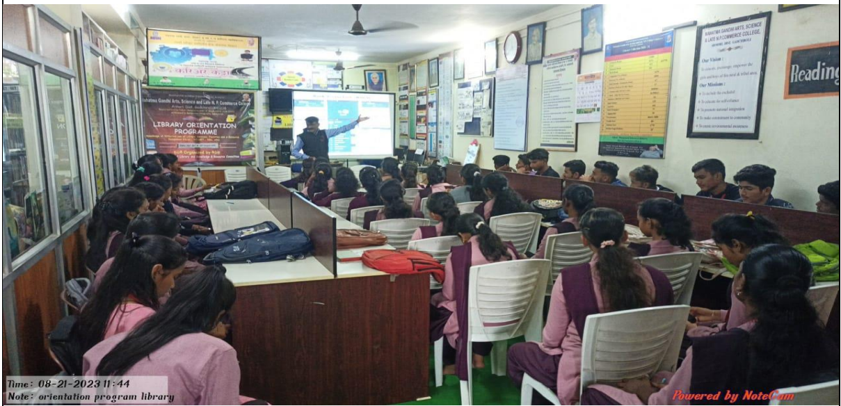
Date 22<sup>nd</sup> August 2023